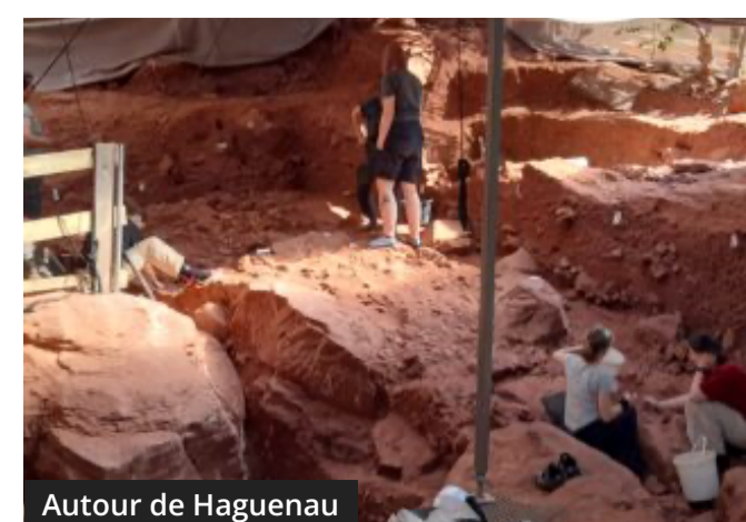
Autour de Haguenau

Nord-Alsace – Fouille après fouille, la terre révèle ses secrets