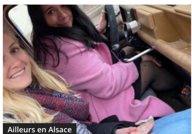
Ailleurs en Alsace

Ingwiller – Dix mois de préparation pour dix jours au 4L Trophy