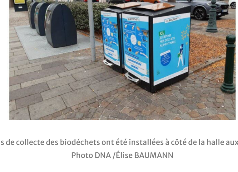
Des bornes de collecte des biodéchets ont été installées à côté de la halle aux Houblons.

Une manière de prolonger l'action de leur entreprise, qui s'est donné pour mission d'organiser la collecte des biodéchets d'une trentaine de restaurateurs, cantines d'entreprises et artisans, et de nouvelles structures (cliniques, fleuristes...) ont récemment rejoint l'aventure. 700 particuliers ont aussi reçu des bioseaux et peuvent ainsi valoriser leurs restes de repas et épluchures de légumes et de fruits. Depuis, 145 tonnes ont été récupérées, dont 70 sur les marchés de la CAH (Bischwiller, Haguenau...) et sur le point d'apport volontaire situé près de la halle aux Houblons, et 15 tonnes au sein de cantines. L'entreprise s'est associée à Apoin, installée à Schweighouse-sur-Moder, une structure d'insertion qui récupère les biodéchets et en assure la transformation en compost après y avoir ajouté de la matière carbonée. Après fermentation, le compost est récupéré, puis commercialisé comme fertilisant.